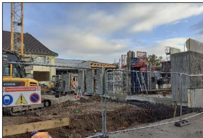
Agrandissement et rénovation de l'école maternelle, construction d'un périscolaire.